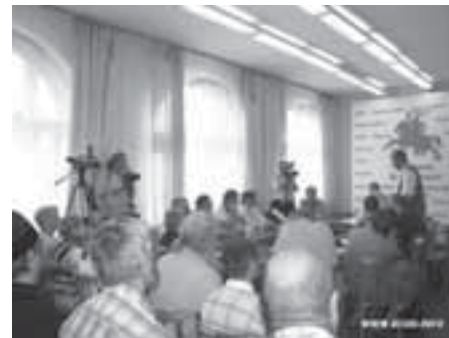
Пасля канферэнцыі адбыўся бардаўскі канцэрт.

Выступоўцы-былія дэпутаты распавялі пра акалічнасці прыняцця Дэкларацыі незалежнасці 27 ліпеня 1990 года, якая стала падмуркам рэальнай незалежнасці нашай краіны. У тым ліку былі згаданыя тыя пункты дакументу, што былі распрацаваныя дэмакратычнымі дэпутатамі, але не прынятыя тагачасным Вярхоўным Саветам.